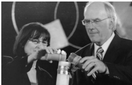
加拿大法裔和英裔 共点合一的婚烛。

2005年8月28～31日，在魁北克有“一心”（One Heart）聚集，三千人代表加拿大的教会首次作为主的新妇，盛装出席。