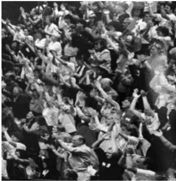
聚集从加拿大母腹一开始， 每一场都经历神荣耀的临在！

他们的意见很合理。但当大家再次寻求主，祂没有改变祂的计划！于是，他们决定顺服神“不合理”的计划，在 1998 年 11 月 11 日举行聚集。令他们大为惊讶的是，全国各地有超过 600 人回应。