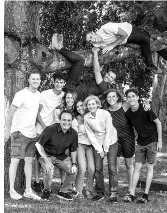
戴爸和路得师母有七个子女，这是他们一家出去郊游的照片。